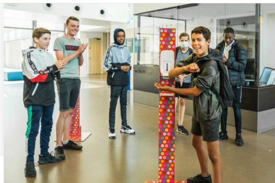
Handen ontsmetten op Stad en Esch.